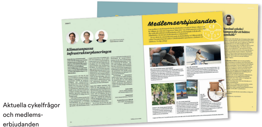
Aktuella cykelfrågor och medlemserbjudanden