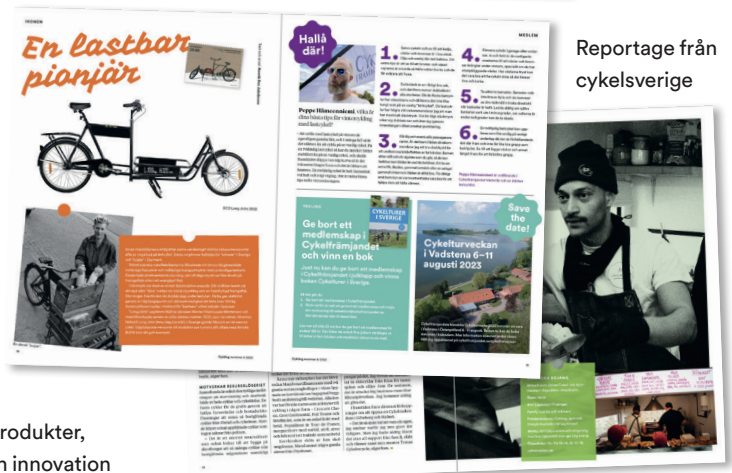
Reportage från cykelsverige