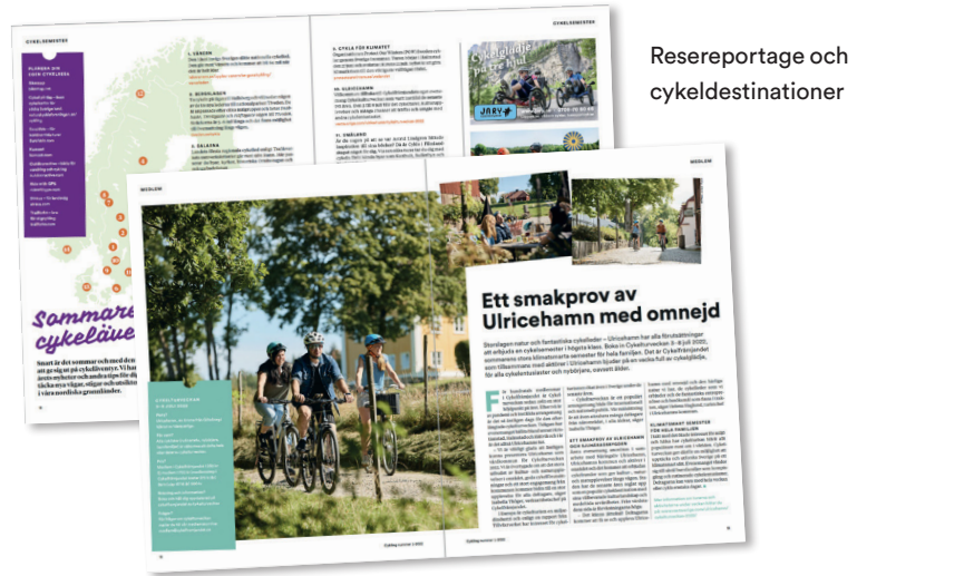
Resereportage och cykeldestinationer

Cirka 6 000 exemplar/nummer. Kontakta oss gärna för aktuell information om upplaga och innehåll.