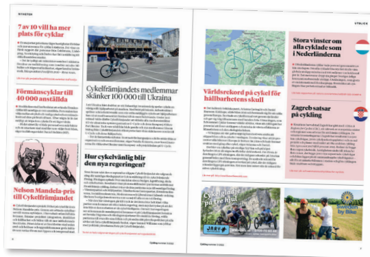
Nyheter och notiser