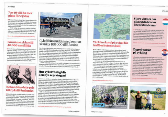
Nyheter och notiser