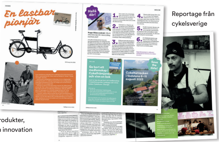
Reportage från cykelsverige