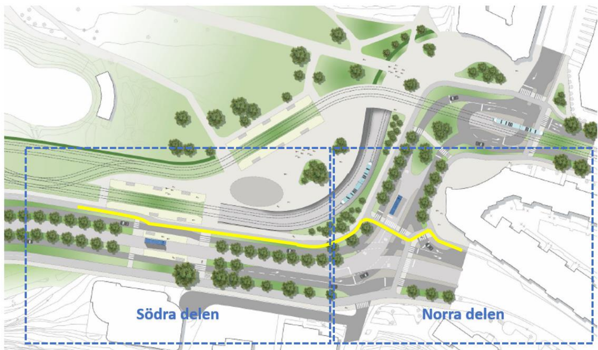
Figur 1 - Östligt alternativ. Gul linje är förvaltningens förslag till cykelbana.

Så som förslagen presenteras i nuläget förordar Cykelfrämjandet Göteborg de östliga alternativen. Detta då de möjliggör rakast dragning av pendlingscykelbanan i den södra delen och undviker korsande av spår hela vägen (figur 1). Vi ser dock att förslaget på korsningen i den norra delen i det här förslaget är problematisk p.g.a. att cyklister behöver zick-zacka över flera körfält.