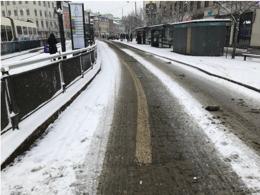
Kungsportsplatsen med cykelfält t.v. Lätt för buss men svårt för cykel.

Man bör prioritera pendlingscykelstråk utan att glömma bort partier som idag går i blandtrafik. Vidare är cykelfält viktiga, eftersom de så ofta får ta emot snömodd från intilliggande biltrafik. Dessutom kan cykelvänliga leder till skolor vara viktiga.