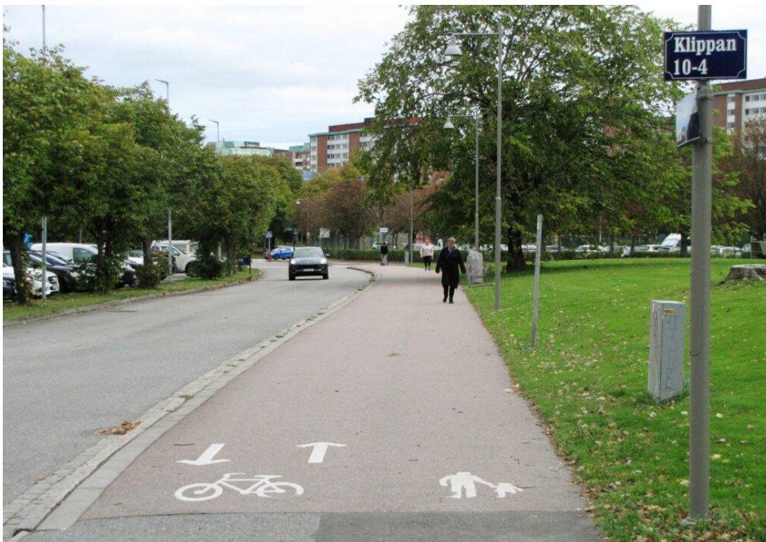
Mjuk separering vid Adolf Edelsvärdsgata i Göteborg.

Om det på delsträckor behöver vara en blandad gång- och cykelbana även i fortsättningen, önskar vi att den märks upp för ”mjuk separering” så att markeringarna inte uppmanar alla att placera sig i mitten, eller att vissa gående följer trafikförordningens budskap att korsa banan två gånger för att gå till vänster på det oseparatorade partiet.