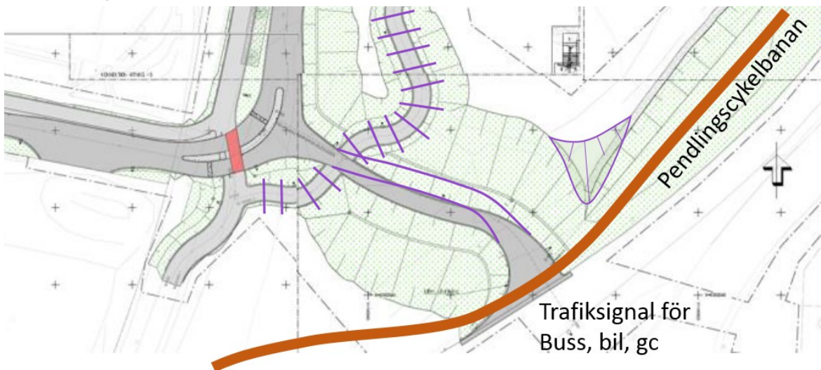
Bild på sid 36 i detaljplanens planbeskrivning med skärningar och våra ändringsförslag inritade.

För att bussförarna ska få god sikt när de ska köra ut på billeden behöver skärningar göras i kullen. Eftersom detaljplanen på sid 34 anger att utfarten ska signalregleras måste även fordon på billeden i god tid kunna se trafiksignalen. Detaljplanen visar skärningar i marken i sin bild på sid 36. Vi föreslår att den spetsiga ås nära utfarten som lämnats kvar men som begränsar sikten också skärs bort. I gengäld behövs inga skärningar i den krokiga cykelbana som vårt förslag ersätter.