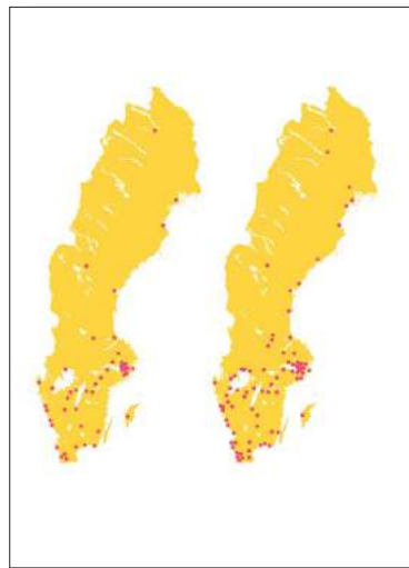
KARTLÄGGNING BASERAD PÅ ENKÄTFRÅGOR OM CYKLING