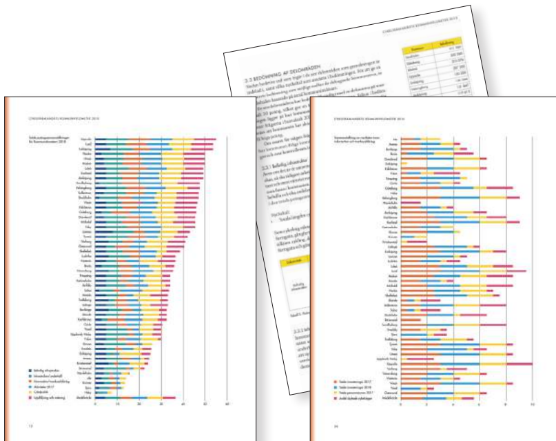
MÄTNING OCH JÄMFÖRELSE AV BEFINTLIG CYKELINFRASTRUKTUR