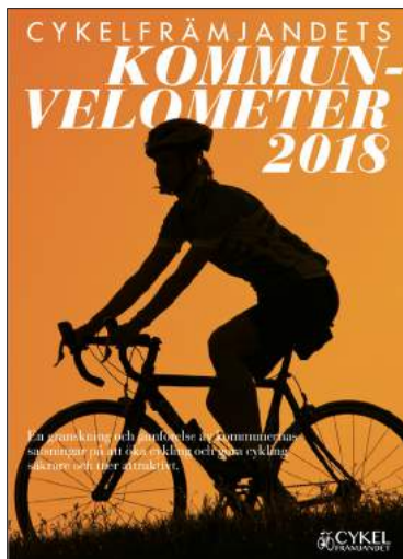
RAPPORT SOM BESKRIVER KOMMUNERNAS CYKELARBETE

Cykelfrämjandets Kommunvelometer är en granskning och jämförelse av kommuners arbete med cykelfrågor. Som deltagare får ni en rapport som både beskriver kommunens nuläge och hur den står sig i förhållande till andra kommuner, samt konkreta rekommendationer om inom vilka områden förbättringar kan ske.